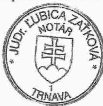
Slávka Komárová zamestnanec poverený notárom