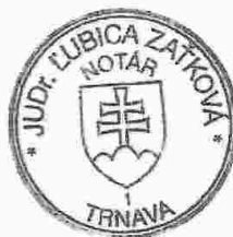
Slávka Komárová zamestnanec poverený notárom