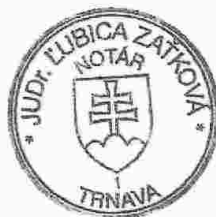
Slávka Komárová zamestnanec poverený notárom