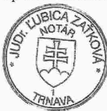
Slávka Komárová zamestnanec poverený notárom