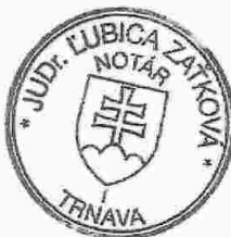
Slávka Komárová zamestnanec poverený notárom