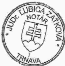
Slávka Komárová zamestnanec poverený notárom