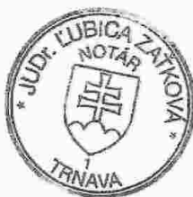
Slávka Komárová zamestnanec poverený notárom