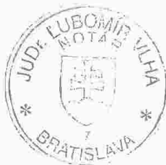
Lívia Noškovičová zamestnanec poverený notárom