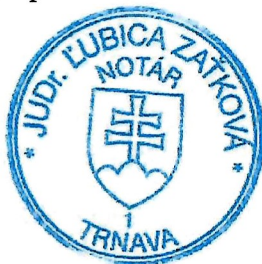
Slávka Komárová zamestnanec poverený notárom