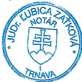
Slávka Komárová zamestnanec poverený notárom