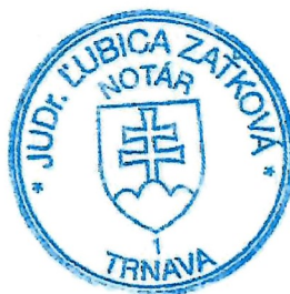
Slávka Komárová zamestnanec poverený notárom